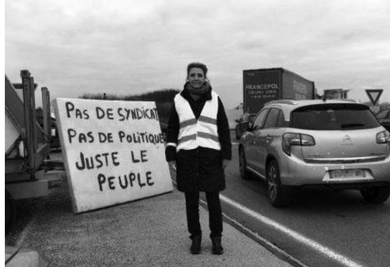
Το σύνθημα που φαίνεται στην πιο πάνω φωτο είναι πολύ χαρακτηριστικό της δεξιάς φύσης του κινήματος και γράφει: «Όχι συνδικάτα, Όχι πολιτική, Μόνο ο λαός»

Το πρώτο σημείο είναι ότι και στα δύο οι ηγεσίες αρνήθηκαν να καταδικάσουν τους φασίστες που συμμετέχουν σε αυτά και κυρίως το φασιστικό κόμμα που τα υποστηρίζει (λεπενικό κόμμα και ΧΑ αντίστοιχα). Επίσημα η ηγεσία των γιλέκων καλύφθηκε για να μην πάρει θέση κατά της Λεπέν λέγοντας ότι δεν δέχτηκε κανέναν εκπρόσωπο κόμματος να συμμετέχει στο κίνημα. Αυτό βέβαια δεν λείπει τίποτα στους δημοκράτες όταν σε υποστηρίζουν φασίστες και εσύ δεν μιλάς. Η αποκάλυψη τους όμως βρίσκεται στο ότι και η ηγεσία