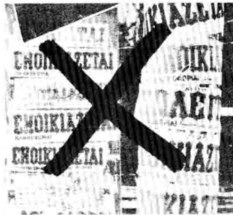
Αυτό κάνει με ένα τρόπο, πρώτο άμεσα και δεύτερο έμμεσα.

Την έβαλε στο χέρι το χρηματιστικό - κρατικό κεφάλαιο για ν' αυξήσει τα δικά του κέρδη και σ' ένα βαθμό για λογαριασμό του ιδιωτικού βιομηχανικού και εμπαιρικού κεφαλαίου. Με λίγα λόγια την έβαλε στο χέρι ο καπιταλιστής, ακριβώς επειδή απέναντί του δεν έχει το μεγάλο γαιοκτημόνα οργανωμένο σε τάξη, αλλά ένα ορμητικό μικροαστόν ιδιοκτήτη.