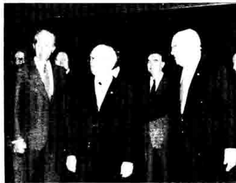
Παπανδρέου - Χόνεκερ

Στο κοινό ανακοινωθέν υπάρχουν δυο ακόμα σημεία που απειλούνται ελληνικούς προβλημάτων δείχνουν τόσο τη γραμμή του σοσιαλϊμπεριαλισμού στην περιοχή μας, όσο και την ποιότητα της συ-